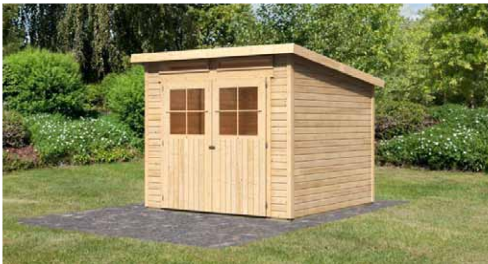
Garten- bzw. Gerätehütten dürfen nur in gewidmetem Bauland errichtet werden

Wir möchten Sie daher in Ihrem eigenen Interesse bitten, vor Errichtung des Gebäudes mit der Baubehörde (Gemeindeamt) Kontakt aufzunehmen und die Zulässigkeit bzw. gegebenenfalls die Anzeige- bzw. Baubewilligungspflicht abzuklären.