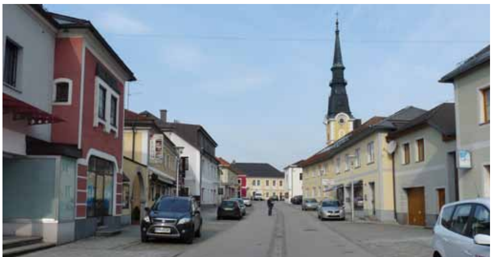
Im Ortszentrum von Ulrichsberg findet am 31.05. und am 01.06.2014 das Fest statt

Das genaue Programm wird noch rechtzeitig veröffentlicht. Der Kulturausschuss der Marktgemeinde Ulrichsberg ersucht schon jetzt um zahlreichen Besuch.