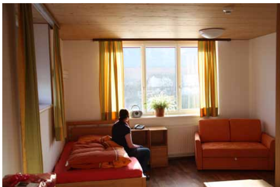
Das Krisenzimmer bietet Raum für Ruhe, um neue Kraft zu tanken