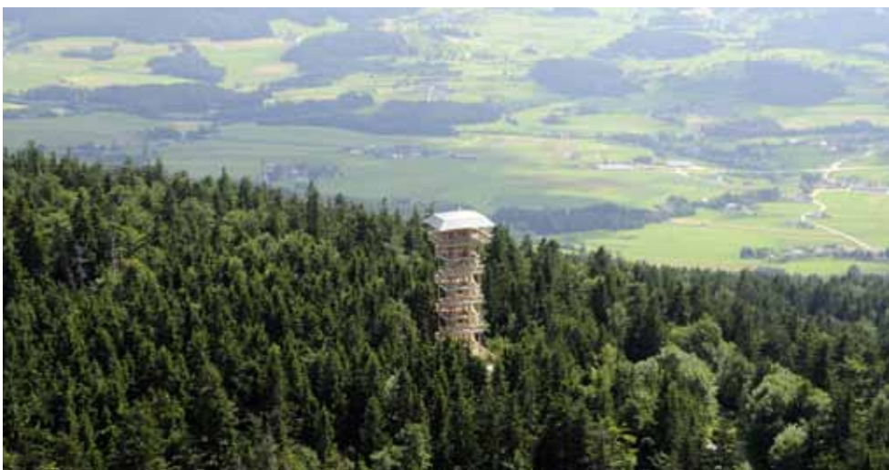
Morgens bis abends kann man am Alpenblick (Foto) und am Moldaublick stimmungsvolle Augenblicke einfangen

erreichbar. Der Eintritt kostet pro Turm für Erwachsene € 2,- und für Kinder beim Alpenblick € 1,- (€ 0,- für Moldaublick). Kinder unter 6 Jahren sind frei. Auch sind für Gruppen ab 10 Personen Gruppenkarten zu einem Preis von € 1,50 erhältlich.