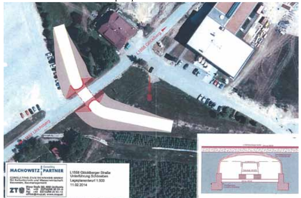
Bei der Glöckelberger Landesstraße in Schöneben entsteht die neue Unterführung

gerät über ein EU-Projekt angeschafft werden. Auch dieses soll bereits in der Wintersaison 2014/2015 zum Einsatz kommen.