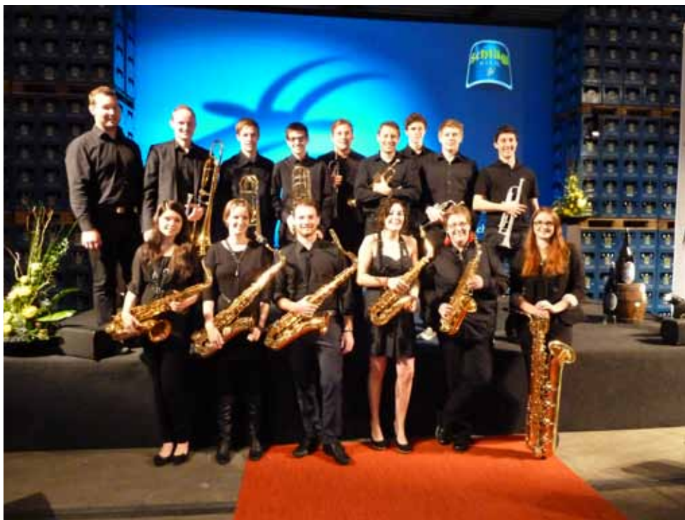
Die Landesmusikschule Schlägl veranstaltet am 16.05.2014 im Reitinger Steinbruch ein Open Air Konzert der Big Band Brassaxes Junior

Die bestens ausgebildeten und hoch motivierten Lehrerinnen und Lehrer des Oberösterreichischen Landesmusikschulwerkes freuen sich auf Ihr Kommen.