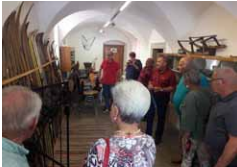
Führung im Kultur- und Heimathaus

Eine Delegation unserer Partnergemeinde Baiersdorf stattete der Marktgemeinde Ulrichsberg am Pfingstwochenende einen Besuch ab.