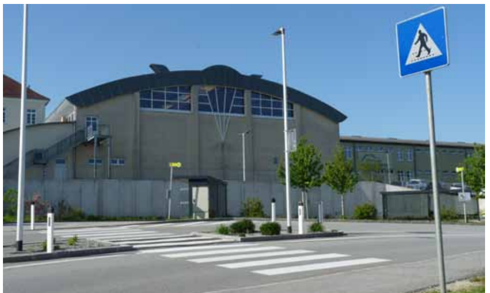
Der neu errichtete Schutzweg im Bereich des Busterminals Ulrichsberg

Damit dieses Vorhaben realisiert werden konnte, mussten zwei zusätzliche Beleuchtungspunkte in den