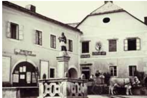
Bild aus dem Jahre 1930 vor dem heutigen Heimathaus

in einen fast 60-jährigen Dornröschenschlaf und geriet somit in Vergessenheit.