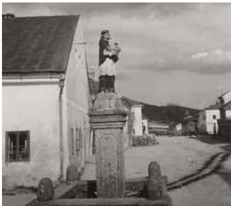
Die Nepomuk-Statue in Ulrichsberg

Eine Johannes Nepomuk-Statue, wohl aus der Zeit um 1730 stammend und von Pfarrer Wolfgang Obermüller (1726-1737) aufgestellt, wurde während des Zweiten Weltkrieges zerstört. Dies hat sich wie folgt zugetragen: Die Statue wurde zu Renovierungszwecken nach Linz zu einem Steinhauer gebracht. Bei einem der zahlreichen Luftangriffe erlitt die Werkstatt einen Volltreffer der das gesamte Gebäude vernichtete, unter anderem unsere Nepomuk Statue.