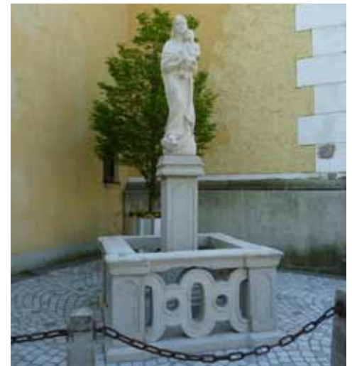
Die Marien-Statue bei der Pfarrkirche