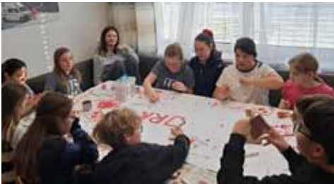
Die Jugendgruppe des Roten Kreuzes.

Am Foto das Team der Ortsstelle Ulrichsberg beim Rot Kreuz Ball. Seit 25 Jahren gibt es die Ortsstelle in Ulrichsberg und sie ist nicht mehr wegzudenken. Die vielen positiven Rückmeldungen, die Unterstützung und der Rückhalt in der Bevölkerung zeigen uns das jeden Tag, dafür möchten wir uns herzlich bedanken. Wie auch schon im letzten Jahr war auch heuer unser Rot Kreuz Ball ein voller Erfolg. Die zahlreichen Besucher haben gezeigt, dass sich diese Veranstaltung als Fixpunkt im Ulrichsberger Ballkalender etabliert hat. Der Erlös wird für die Förderung der Freiwilligkeit an der Ortsstelle Ulrichsberg verwendet.